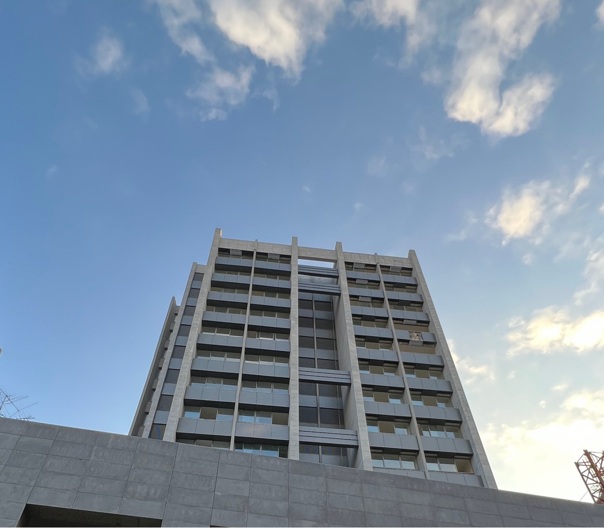
Front Facade View