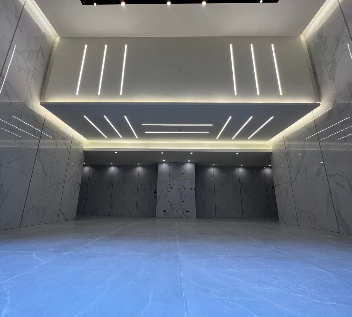
High End Residential Lobby