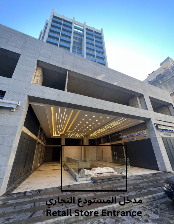
مدخل المستودع التجاري Retail Store Entrance